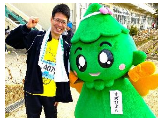
新春マラソン10km完走 ご声援いただきありがとうございました！