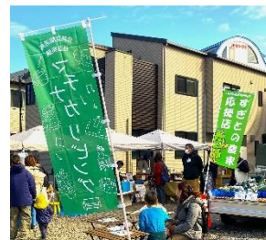
宮代町と共同開催した マチナカリビング

①行政区長の協力による一斉調査（地域の空き家（戸建て住宅に限る）について依頼した調査）から10年近く経過していますが、再調査の予定を伺います。②空き家の所有者所在不明のケースもあり、ご連絡が付かないことも多いと聞いています。例えば、埼玉県で開催されている「相続おしかけ講座」等を当町で開催して、空き家を未然に防ぐ取組を強化していくのはいかがでしょうか。